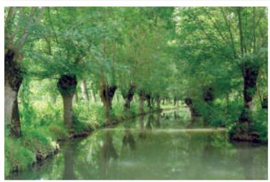
Conche du Marais mouillé.