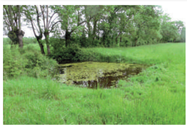
Mare temporaire (en eau une partie de l'année).

Avec près de 110 000 hectares, le Marais poitevin est la plus grande zone humide terrestre et littorale de l'ouest de la France et l'une des plus vastes de la façade atlantique européenne. Par l'omniprésence de l'eau, douce ou salée, courante ou non, le Marais et ses bordures forment une mosaïque de milieux aquatiques très divers. Attachons-nous aux milieux d'eau douce.